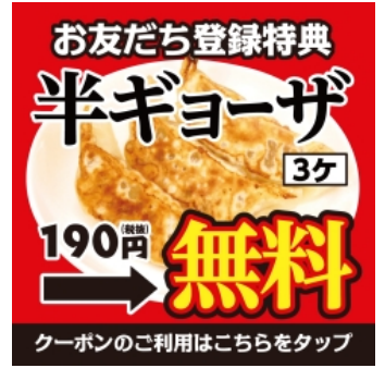
▼実際に配信したメルマガの内容 友だち登録特典や登録方法を配信！